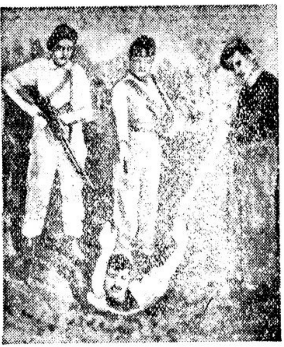
Этот снимок, взятый нами из иллюстрированного журнала «Для тебя, Греция», выпущенного издательством «Свободная Греция» в нынешнем году, является суровым обвинением. Свободные народы мира не забудут запечатленную здесь кровавую сцену: монархо-фашистские головорезы живым захватывают и землю попятого в их руках греческого патриота.