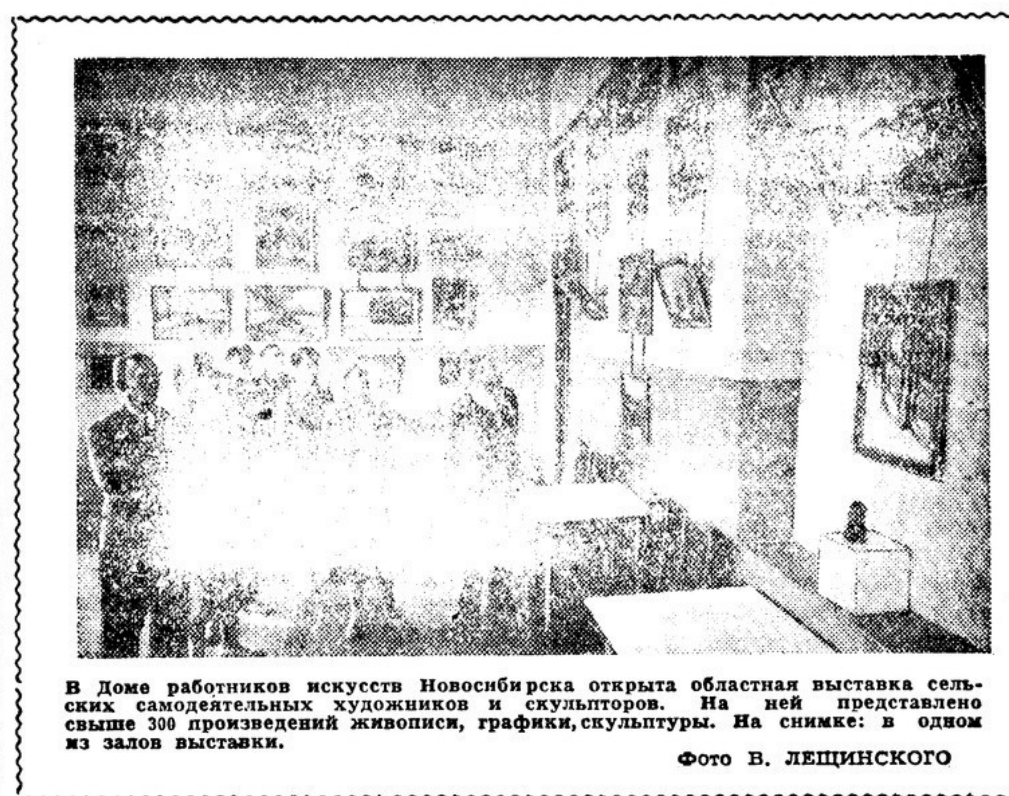
В Доме работников искусств Новосибирска открыта областная выставка сельских самодеятельных художников и скульпторов. На ней представлены свыше 300 произведений живописи, графики, скульптуры. На снимке: в одном из залов выставки.

25-летие газеты «Молдова социалистическая» и выход ее пятнадцатого номера широко отмечается всей общественностью республики.